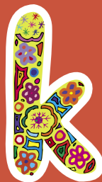
Vydáno 2009, NEPRODEJNÉ.

Grafická úprava: Gabriela Vorlová, tisk Agentura 68, www.68.cz náklad 1500 ks