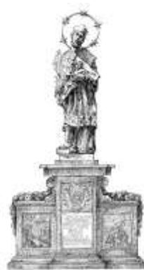
DIVUS JOANNES NEPOMUCENUS

O tom, zda budou tentokrát podpořeny všechny přihlášené projekty, rozhodne nejen Výběrová komise MAS dle jasně stanovených kritérií, ale rozhodnutí bude muset následně zpečetit i Programový výbor a Valná hromada. Konečný verdikt tak bude znám nejdříve ve 2. polovině června, kdy vybrané projekty budou registrovány na RO SZIF v Českých Budějovicích.